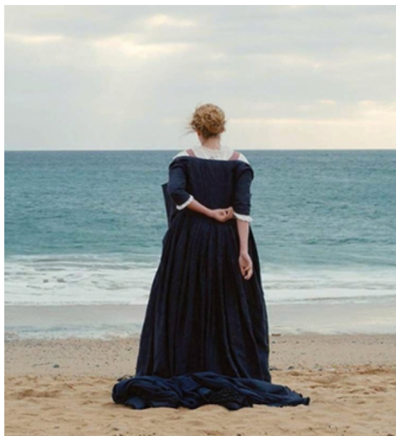
© Portrait of a Lady on Fire

Na madrugada de 28 de junho de 1969, Greenwich Village, em Nova Iorque, tornou-se no palco de uma das maiores manifestações pelos direitos LGBTQ+ vistas até então, após a invasão policial em Stonewall Inn, um bar da região frequentado essencialmente pela comunidade gay. A população saiu à rua com um único objetivo em comum, lutar pela igualdade de direitos, como forma de protesto contra a brutalidade policial e discriminação que se fazia sentir perante a comunidade LGBTQ+.